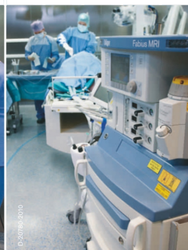
Фаза поддержания анестезии Применение Fabius MRI во время нейрохирургического вмешательства.