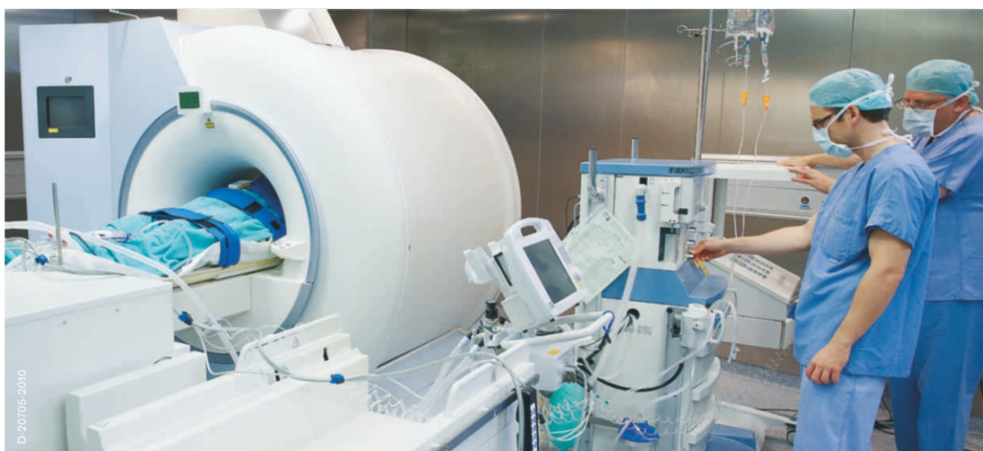
Нейрохирургический комплекс системы для МРТ и операционной Фаза поддержания анестезии. Мониторинг пациентов во время процедуры МРТ (оборудование для анестезии, монитор пациента, шприцевые насосы)