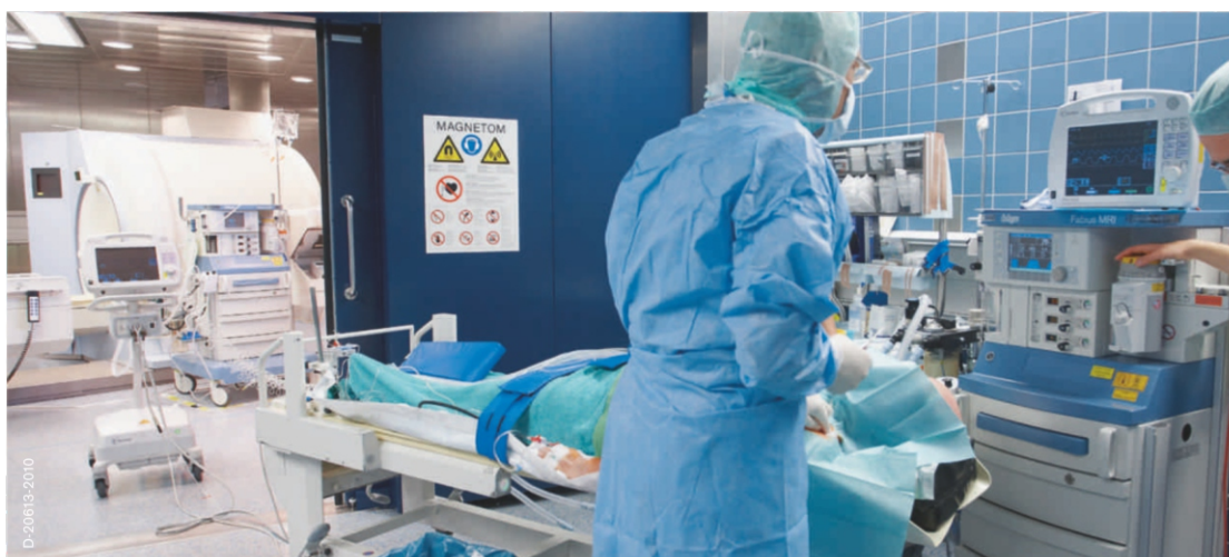
Палата предварительного обследования Применение анестезии у пациентов перед поступлением в нейрохирургическую операционную с МРТ