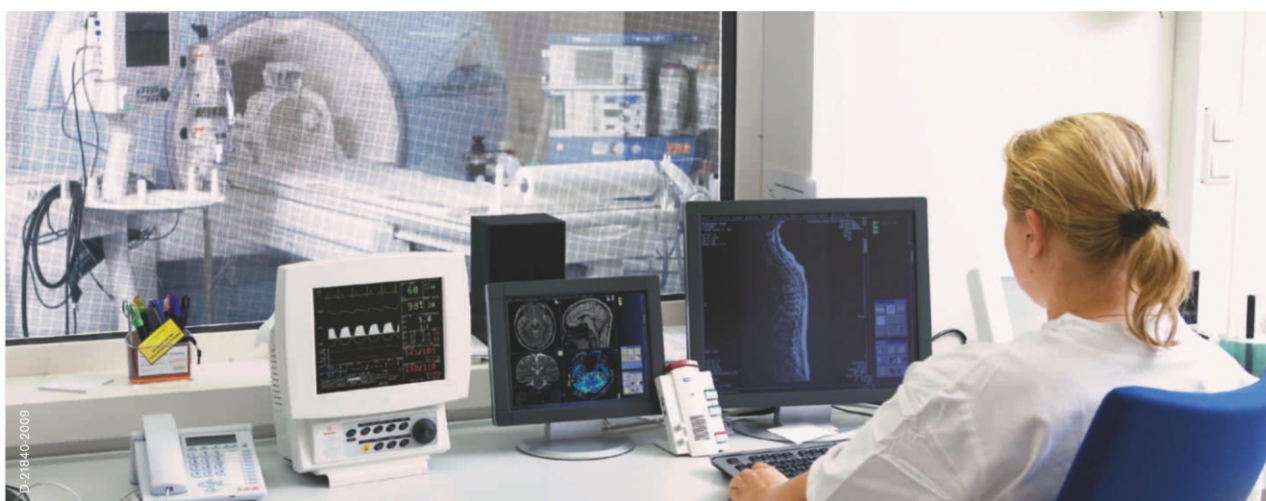
Комплекс МРТ и контрольный пункт Вид с рабочего места оператора. Все в поле зрения и под контролем.