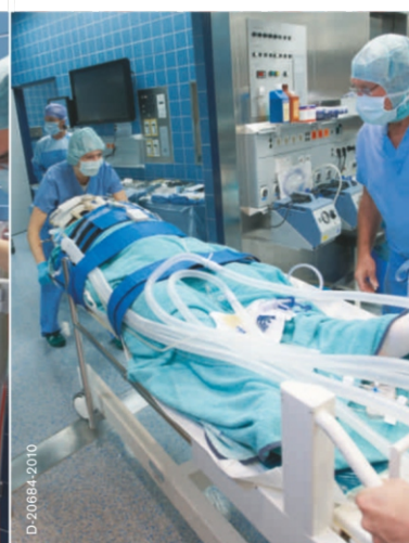
Транспортировка пациентов Транспортировка пациента в операционную, оборудованную средствами МРТ